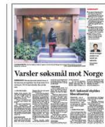
Varsler søksmål mot Norge

Helse- og omsorgsdepartementet hadde ikke mulighet til å kommentere saken i går.